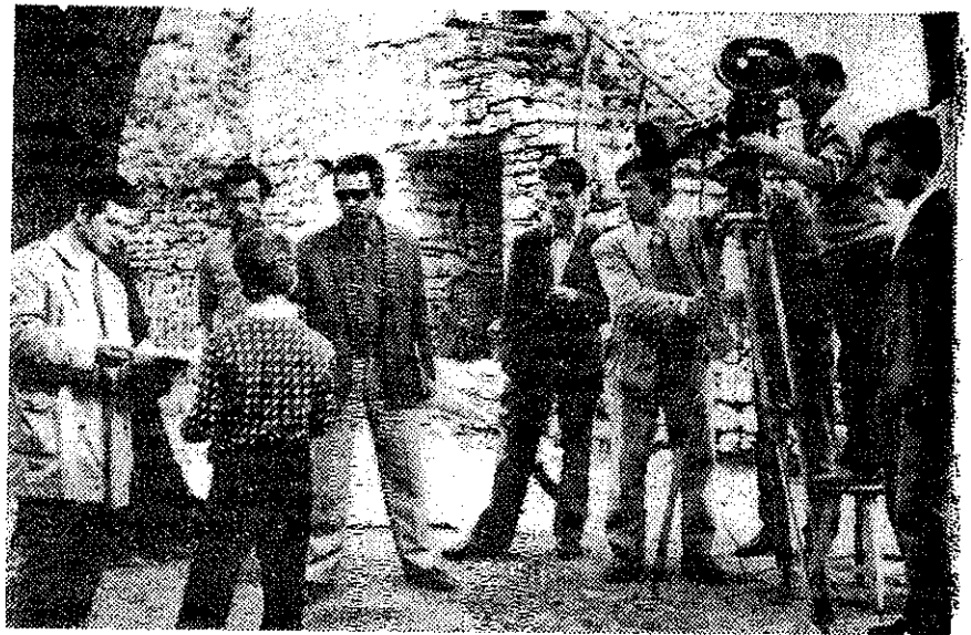
Çaste pune nga xhirimi i filmit.